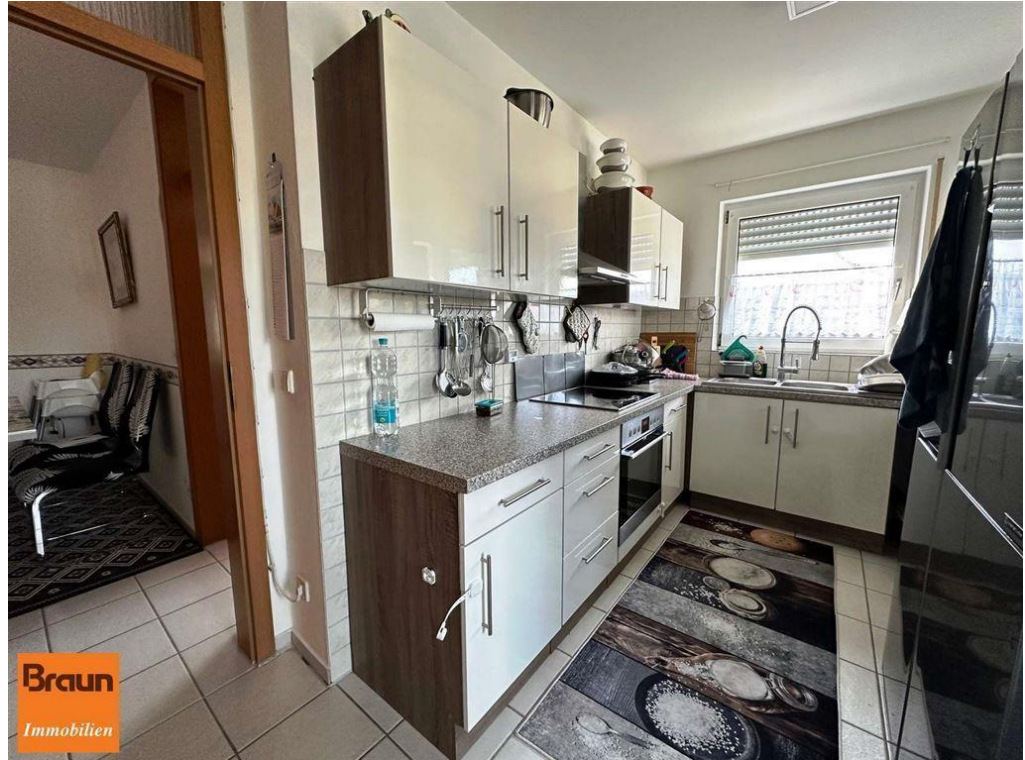
3-Zi.-Mietwohnung, VS-S, 4-7331, Küche