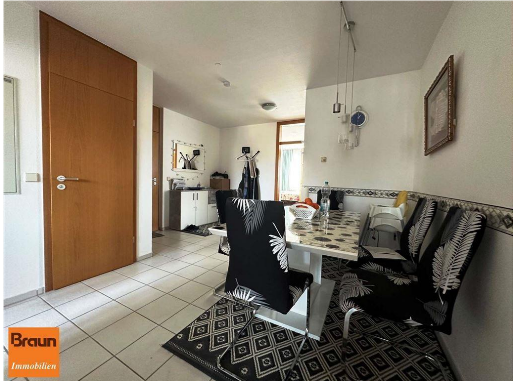
3-Zi.-Mietwohnung, VS-S, 4-7331, Essstiele