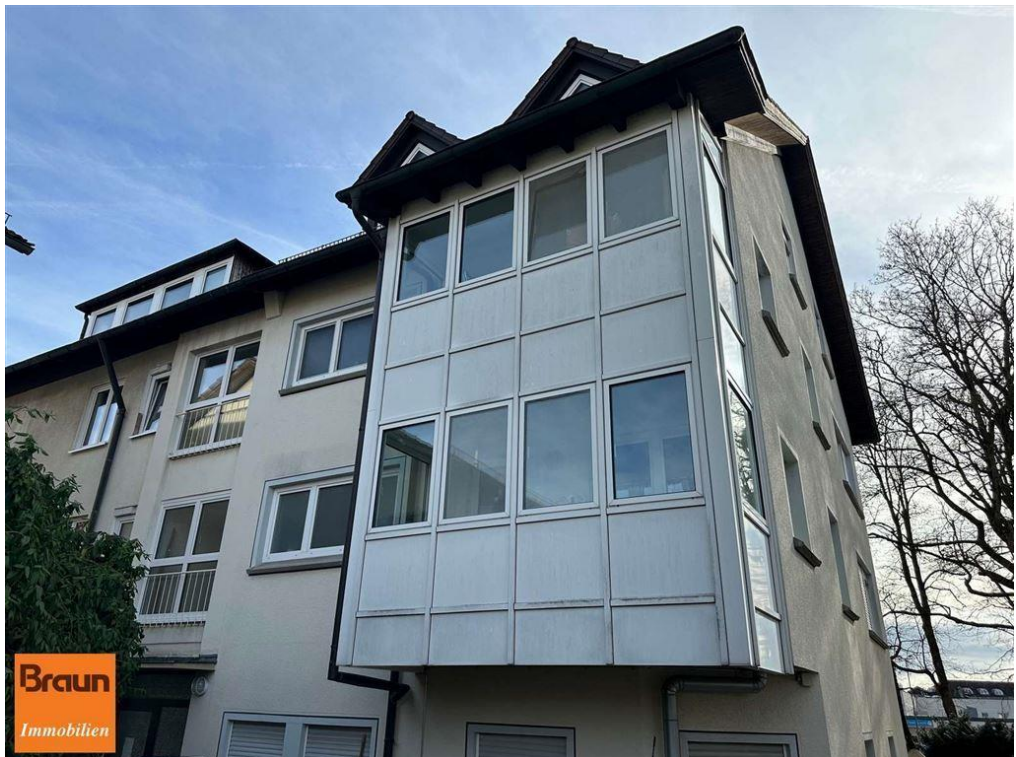
3-Zi.-Mietwohnung, VS-S, 4-7331