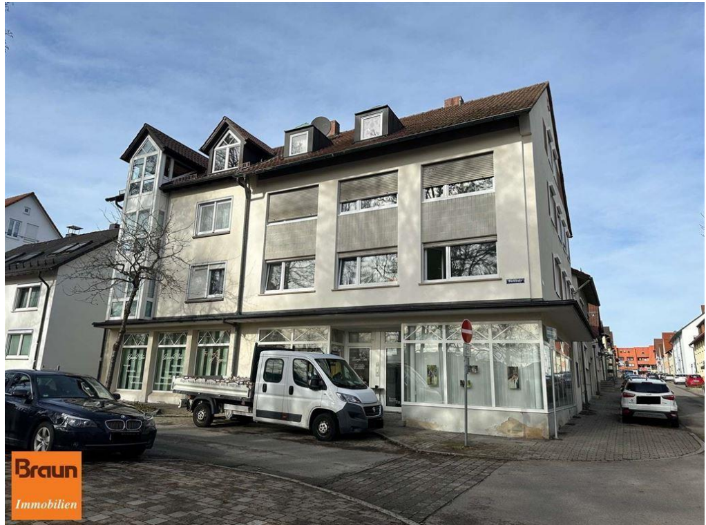
3-Zi-Mietwohnung, VS-S, 4-7331