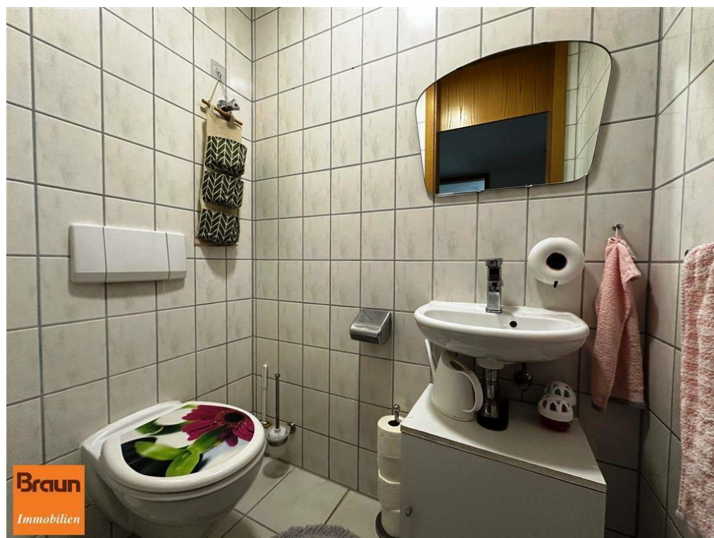
3-Zi.-Mietwohnung, VS-S, 4-7331, Gäste WC