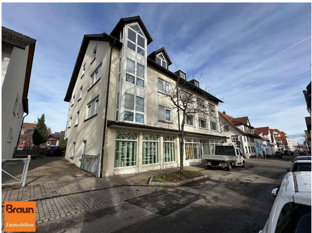
3-Zi.-Mietwohnung, VS-S, 4-7331