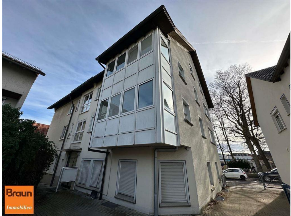
3-Zi.-Mietwohnung, VS-S, 4-7331