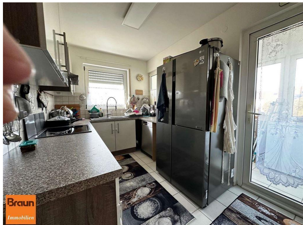
3-Zi.-Mietwohnung, VS-S, 4-7331, Küche