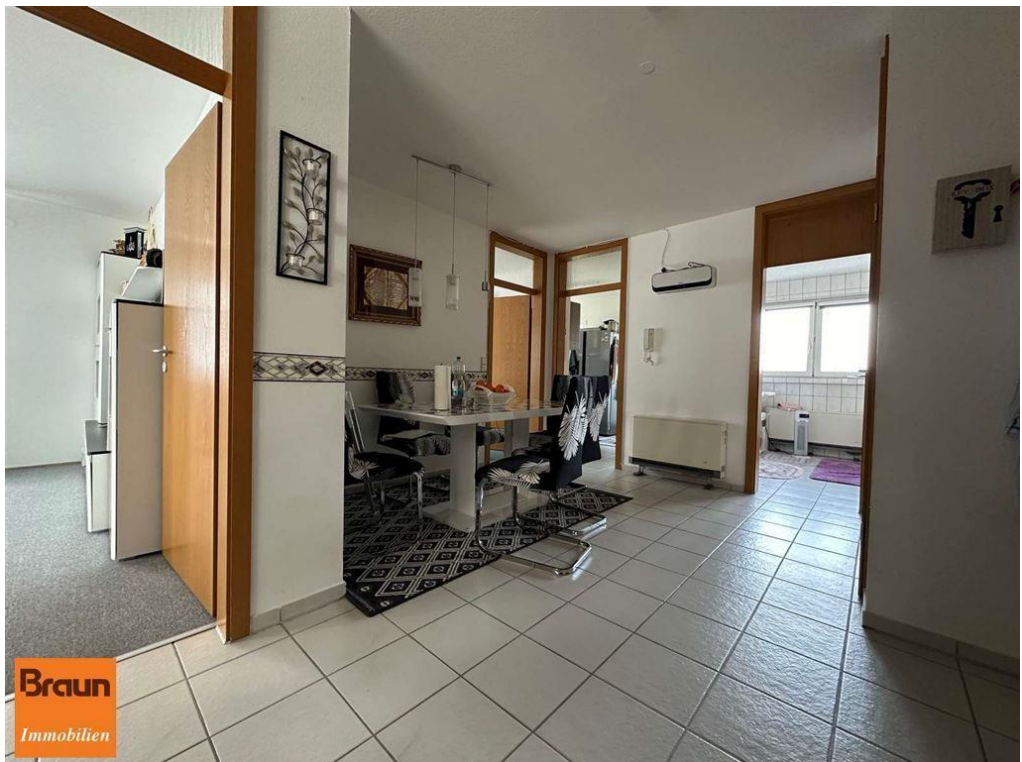
3-Zi.-Mietwohnung, VS-S, 4-7331, Essstiege