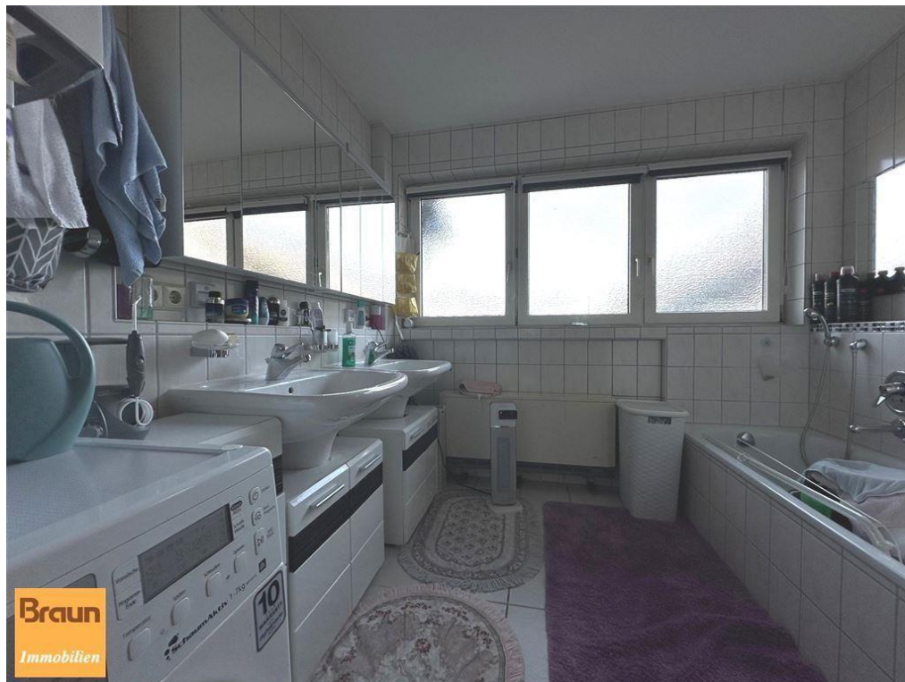
3-Zi.-Mietwohnung, VS-S, 4-7331, Badezimmer