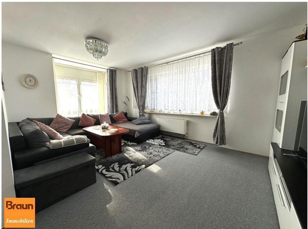
3-Zi.-Mietwohnung, VS-S, 4-7331, Wohnzimmer