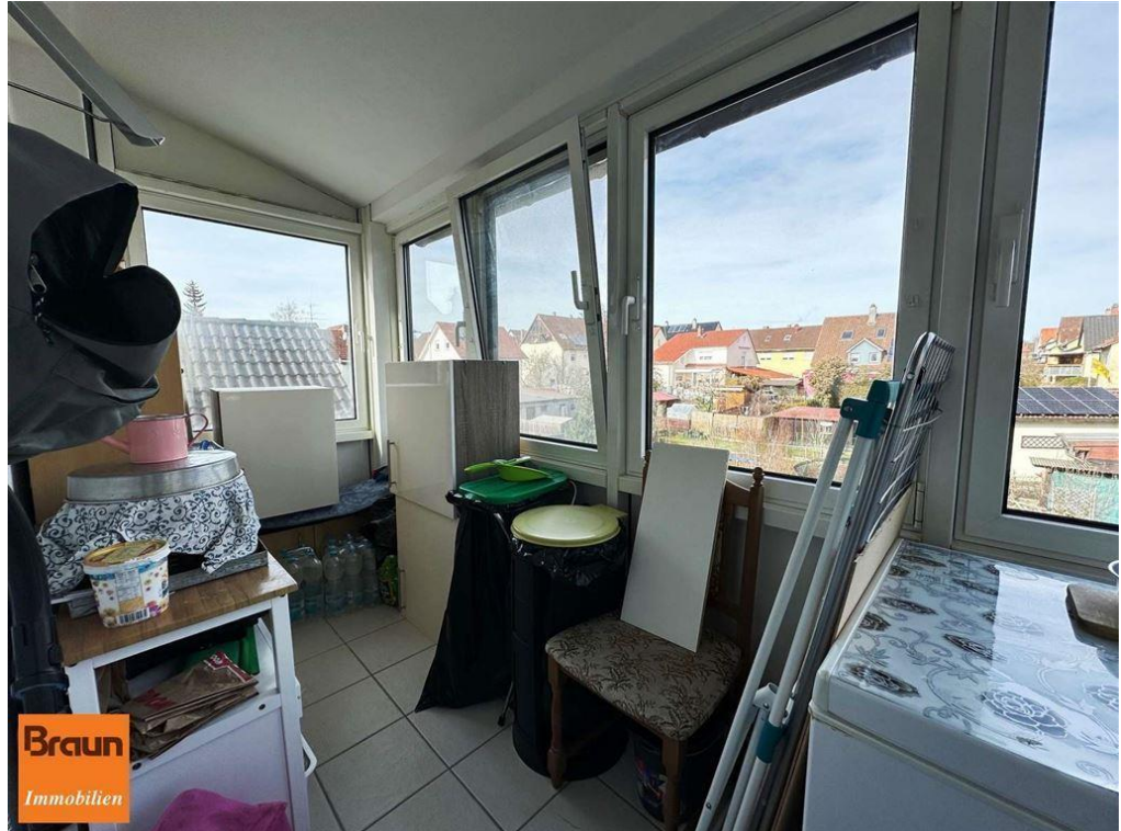
3-Zi.-Mietwohnung, VS-S, 4-7331, verglaster Balkon